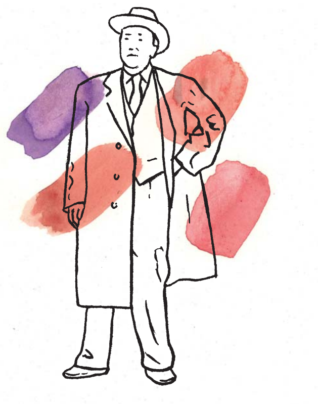
WILLEM ELSSCHOT GENOOTSCHAP BENEFIETDINER 2011

mensen die we delen is zonder twijfel Willem Elsschot en we delen ook zijn erfenis.