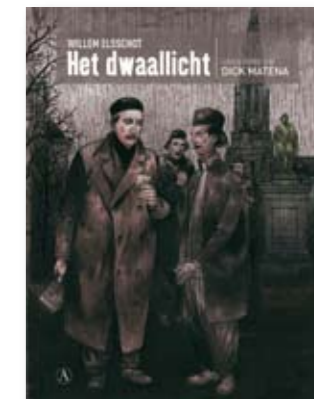
Het Dwaallicht, © Dick Matena, Athenaeum, Polak & Van Genneep, Amsterdam, 2008.

Weet u, ik denk écht dat het kan. Als we toeristisch blijven inzetten op Elsschot, zonder daarom elk jaar weer nieuwe festiviteiten te hoeven verzinnen, dan zou zijn bekendheid in het buitenland stijgen, net als de verkoop van de vertalingen. En aangezien het een uitermate toegankelijk en vrij komisch oeuvre betreft, kunnen Elsschots boeken de mensen