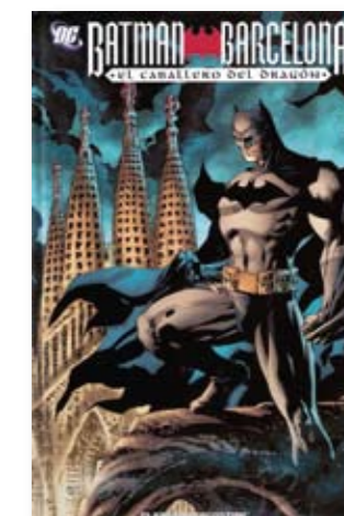
Batman: Barcelona, El Caballero del Dragón, © Mark Waid en Diego Olmos, Planeta De Agostini Comics, 2009.